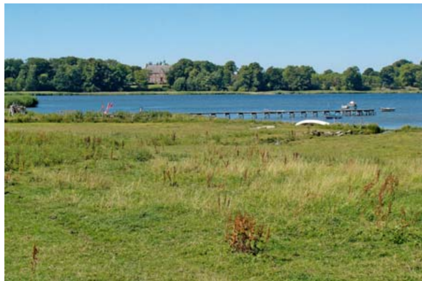
Kertinge Nor er den inderste del af fjordsystemet Kerteminde Fjord – Kertinge Nor. Området er landskabeligt meget smukt.