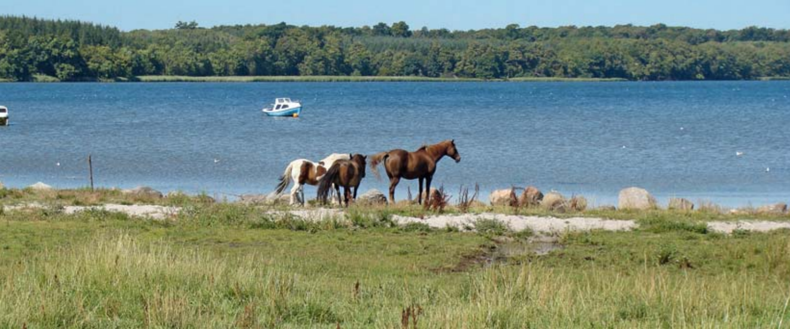
Heste på strandeng ved kirken ved Kertinge. Heste er udmærkede naturplejere og er med til at holde strandengens vegetation kort.