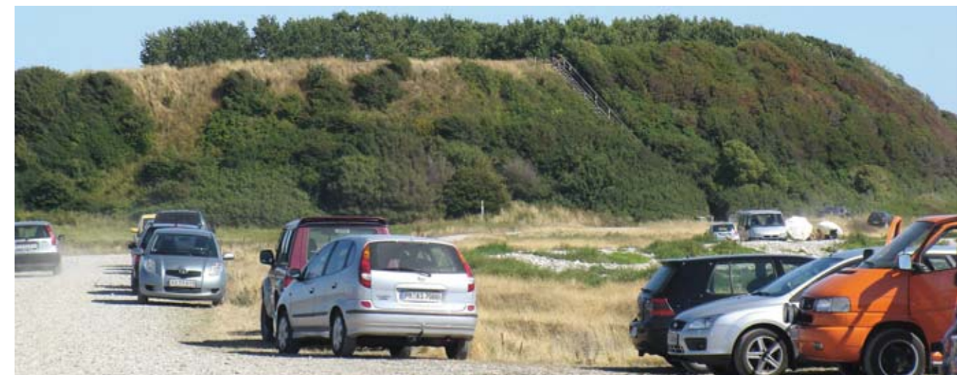
Der er en fantastisk udsigt fra Jøvet ved Fyns Hoved. Samtidig er stedet en fremragende lokalitet for planter og insekter. Jøvet gror dog for meget til og skal plejes.