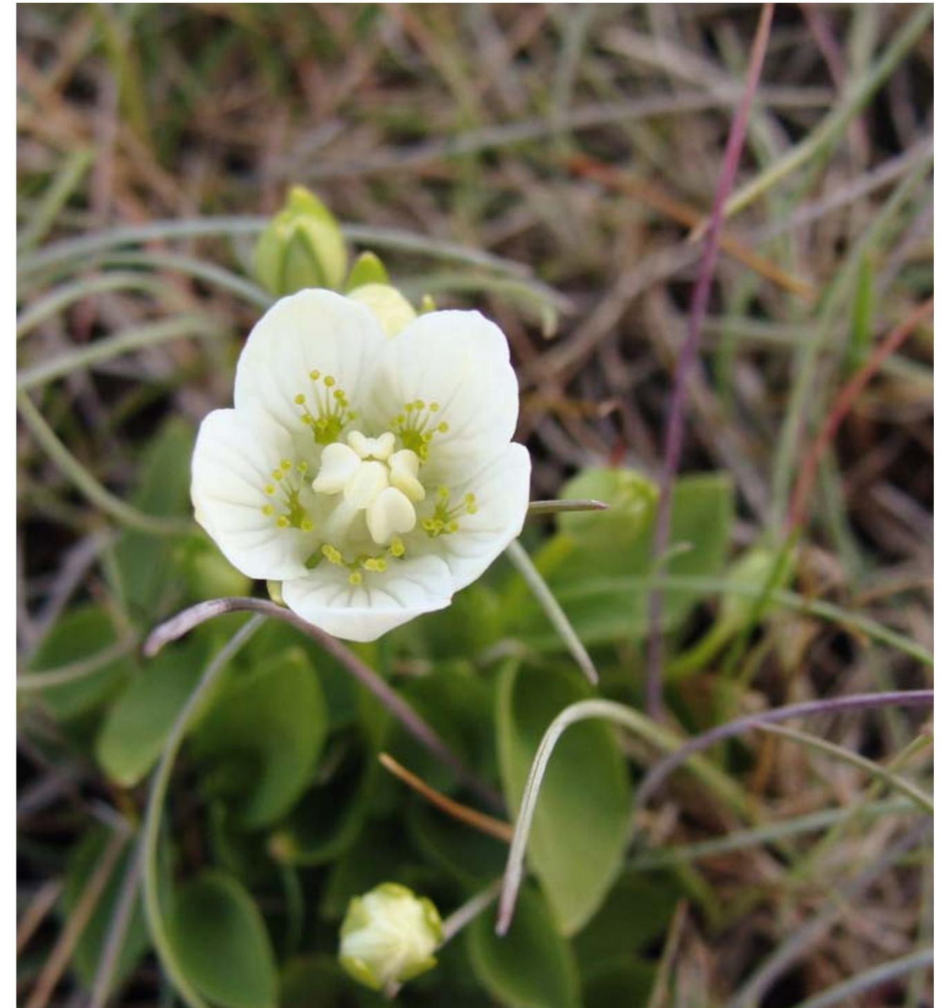
Leverurt findes stadig i Kerteminde Kommune, men er særdeles sjælden. Også den er helt afhængig af naturpleje i form af afgræsning eller hæslet.