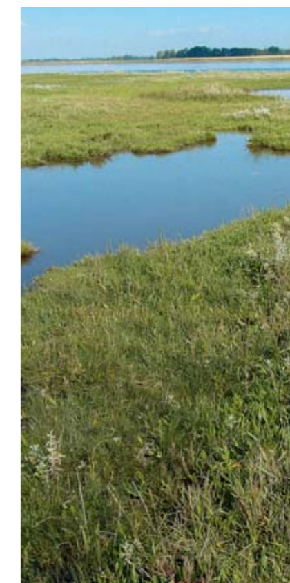
Dele af Tornø i Odense Fjord afgræsses og høslættes. Denne for fuglene helt centrale ø bør overgå til natur. Det vil sige, at hele øen bør afgræsses og høslættes.

enge omkring Vejlø og ved Brockdorff. Desuden er der strandeng på Mejlø og Bogø.