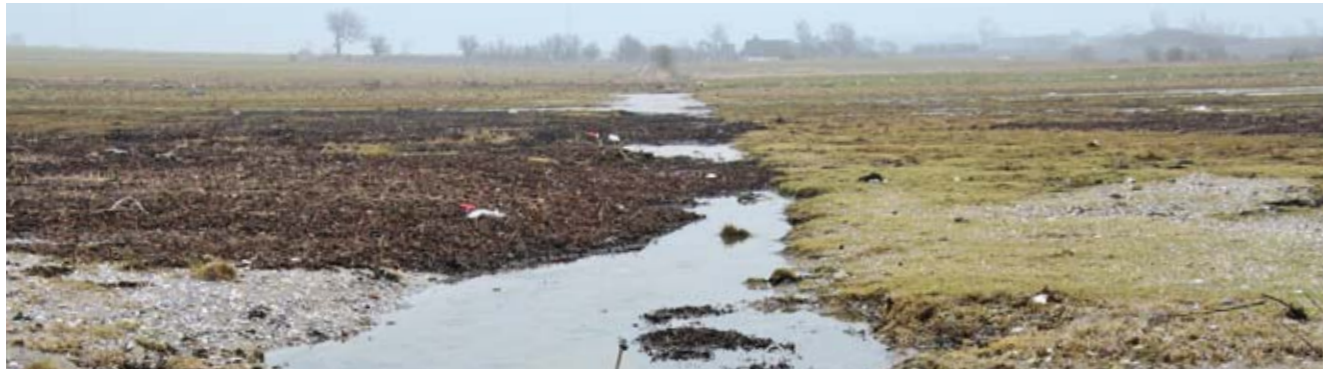
Kanal der ikke er oprenset i Vestermade i Odense Fjord. Kanalerne bør vedvarende IKKE oprenses, fordi det giver oversvømmelser på engene, til stor glæde for ynglende og rastende vandfugle. Desuden kan en del af kvælstoffet i vandet, der kommer fra oplandet, omdannes til uskadelig frit kvælstof.