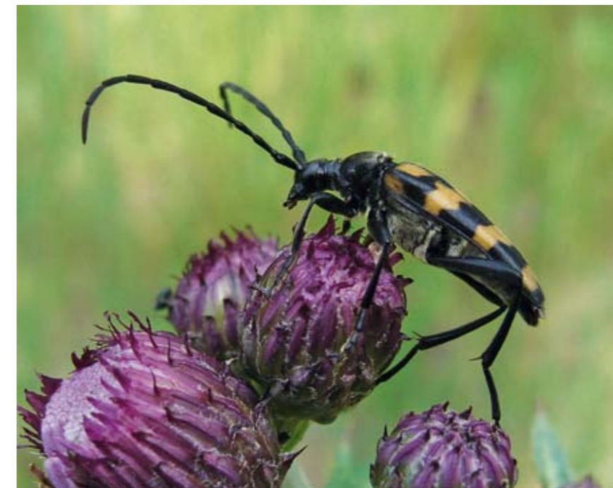
Insekter tiltrækkes af blomsterrige enge, overdrev og moser. Desuden er gammel, urørt skov vigtig for insekter. Her ses en 4-båndet blomsterbuk

Af hensyn til bevaringen af disse dyr er det vigtigt, at lokaliteterne ikke gror for meget til, men passes og plejes.