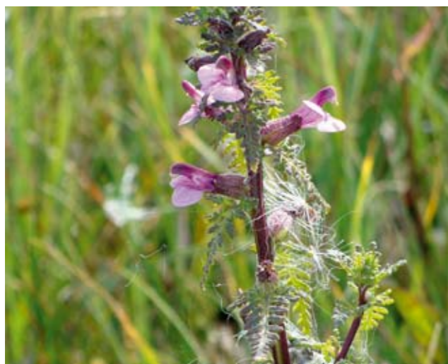
Mose-troldurt er forsvundet fra Kerteminde Kommune. For at ikke flere plantearter skal forsvinde fra kommunen, skal der satses kraftigt på afgræsning af ALLE de vigtige overdrev, moser og enge.

Langakset trådspore – femradet ulvefod – liden ulvefod – brun-fladaks – tue-kogleaks – bredbladet kæruld – liden kæruld – tue-kæruld – børste-siv – ræve-star – tue-star – tvebo star – eng-hejre – hvidgul gøgeurt – pukkellæbe – langakset trådspore – mosebølle – engblomme – tykbladet fladstjerne – kær-fnokurt – dusk-fredløs – klok-kelyng – knude-arve – alm. loppeurt – rosmarin-pil – spyd-pil – mose-pors – rosmarinlyng – liden skjaller – strandbo – krybende sumpskærm – forskelligbladet tidsel – mose-troldurt – rank viol – hvid næbfrø – rundbladet soldug – tranebær – eng-troldurt – pile-alant