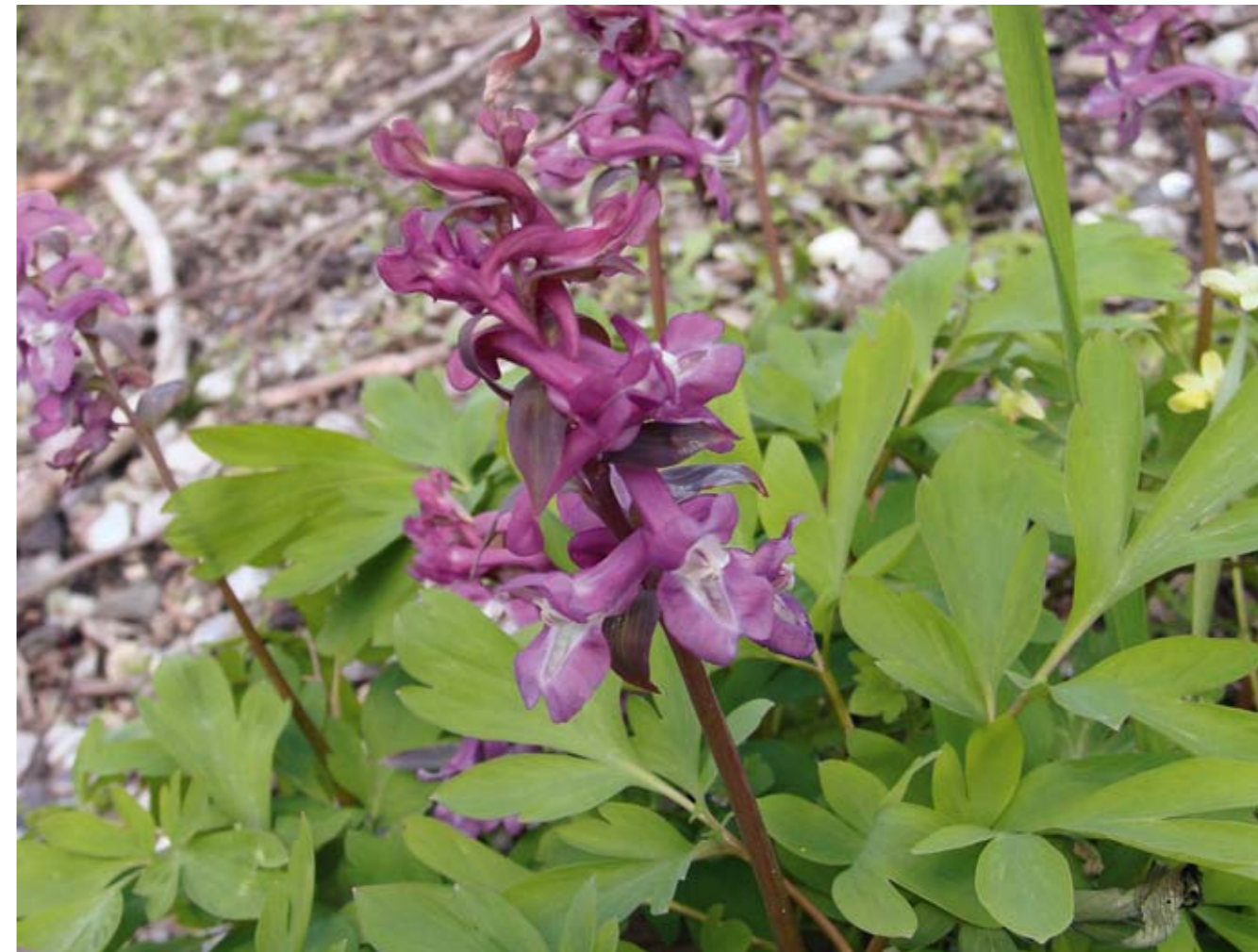
Hulrodet lærkespore findes i nogle af de gode løvskove. Skovene dyrkes generelt intensivt. Det er vigtigt for at øge indholdet af planter og dyr i skovene, at en række skove dyrkes mere ekstensivt, og at stævning genoptages i stævningssskovene.