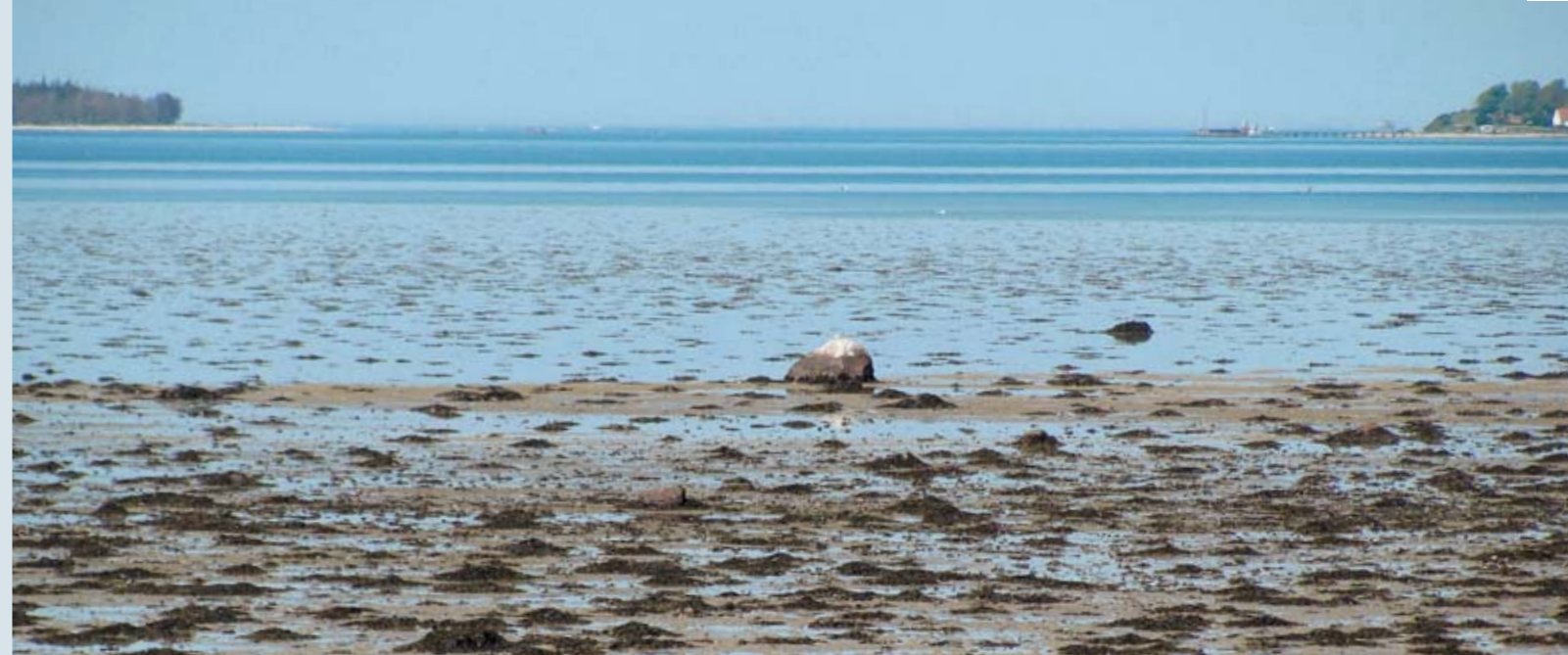
Vadefladerne – først og fremmest i Odense Fjord er særdeles rige fuglelokaliteter. Her raster i titusindvis af fugle, bl. a. nordiske vadefugle som stor regnspove.

© Udgivet af Danmarks Naturfredningsforening · Tlf. 39 17 40 00 · dn@dn.dk · www.dn.dk Støttet med tilskud fra tips- og lottomidler til friluftslivet.