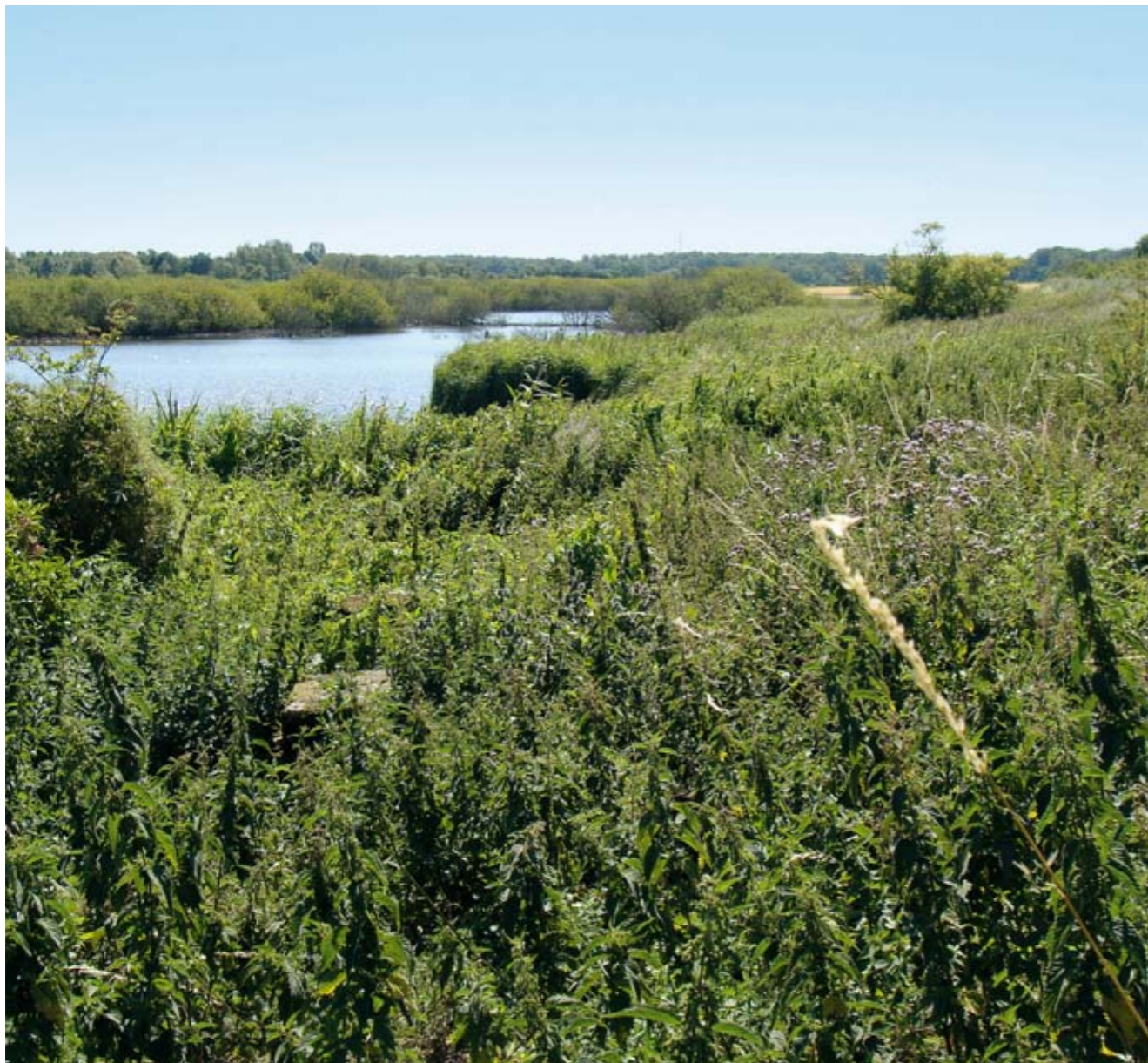
Lavindsgård Mose tæt på Langeskov var tidligere afgræsset i langt højere grad end i dag. Mosen bør indhegnes i sin helhed sammen med en bræmme i dag dyrket mark. Genoptagelse af afgræsningen vil gavne især planter og padder.