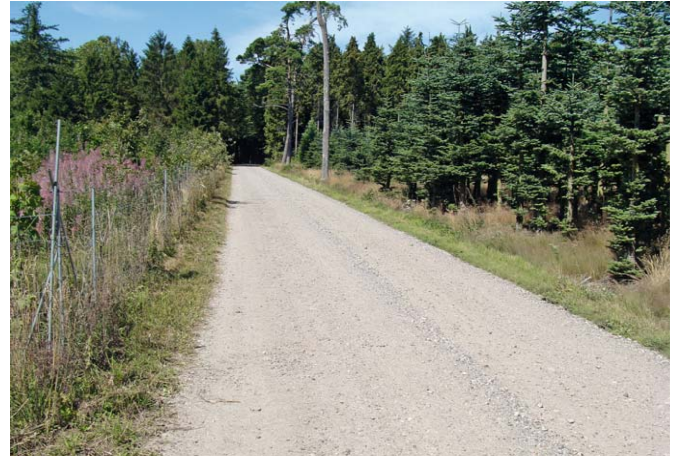
De fleste af vore skove er inderligt uinteressante, fordi de drives så intensivt, bl. a. med klippegrønt. En ekstensivering af driften i kommunens skove er meget påkrævet.