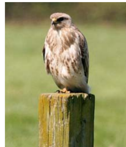
Musvågen er den talrigeste af de trækende rovfugle på Hindsholm. Desuden yngler arten i en del af kommunens skove.

Vadefugle ses især rastende i Odense Fjord, Lillestrand og Fællesstrand/Pughavn. Det gælder bl.a. tusindvis af viger, hjejler og hundredvis af stor regnspeve.