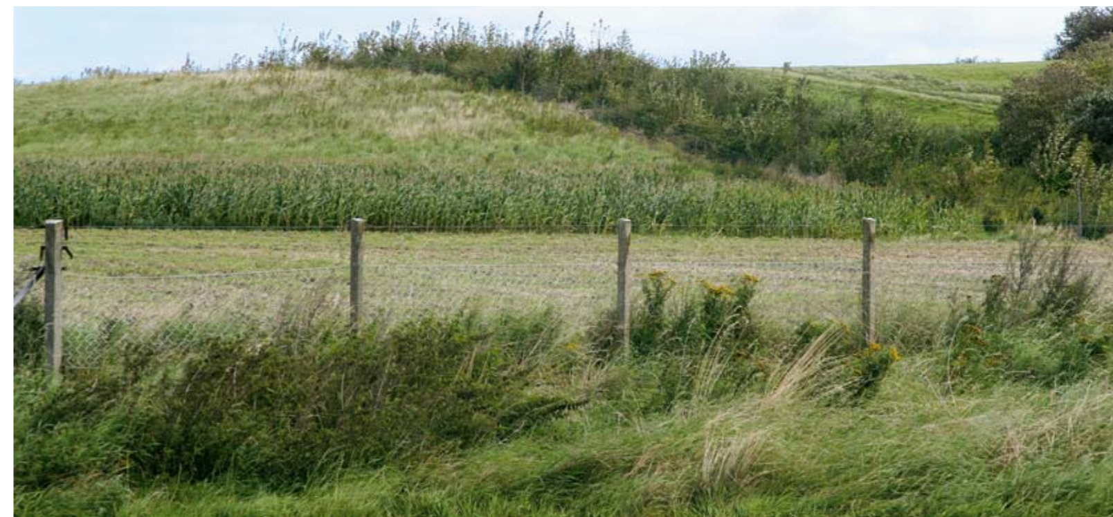
Myrbjerg er et af kommunens mange overdrev. Den rige flora på Myrbjerg er alvorligt truet fordi området groer til / tilplantes. Det er vigtigt at foretage naturpleje i området.