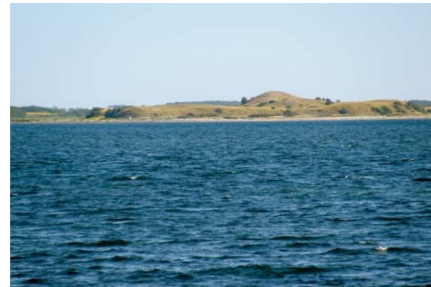
Bogø i Lillestrand rummer betragtelige arealer med overdrev. Øen plejes bedst med kreaturer, i stedet for som nu, med får.