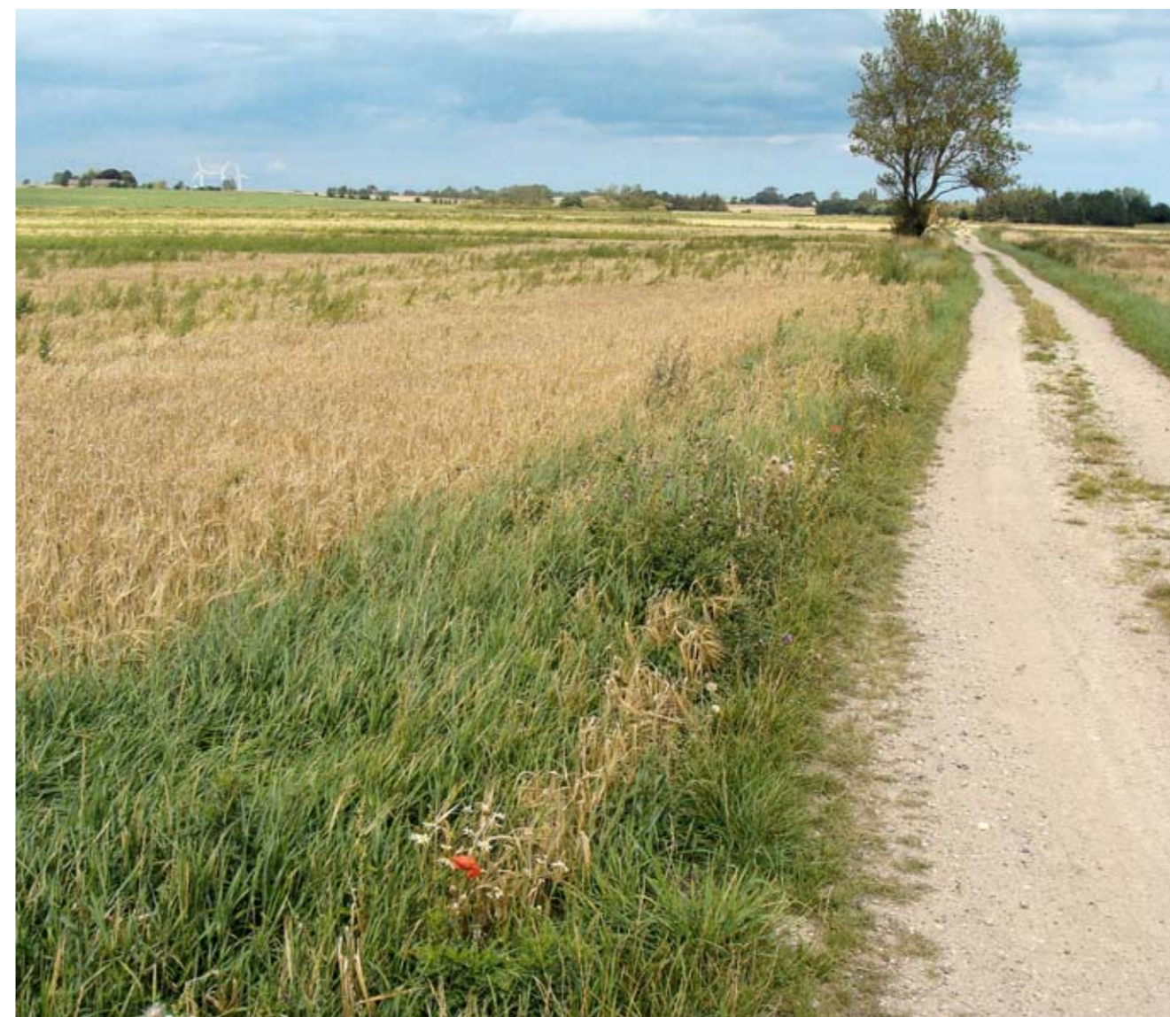
Tårup Inddæmmede Strand er den mest oplagte lokalitet til naturgenopretning – ved "siden" af Dræby Fed. Det er vigtigt, at hele Tårup Inddæmmede Strand genskabes, og at dele IKKE udlægges til golfbane.

Der er et særdeles stort behov for naturgenopretning på Dræby Fed. De 12 møller skal efter vores mening fjernes. Der kan eventuelt opstilles 2 store møller helt mod øst. To møller, der kan producere mere end 4 gange så meget strøm end de tolv gamle tilsammen.