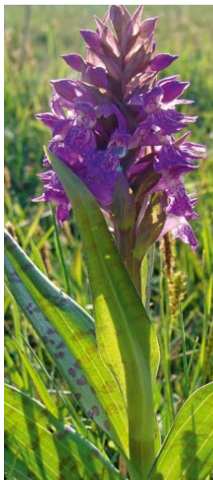
Maj-gøgeurt findes stadig i flere af moserne og engene i kommunen. Men også den er gået kraftigt tilbage. Medicinen er den samme – afgræsning og høslæt, hvis arten skal bevares i Kerteminde Kommune.

De meget tilgroede moser (fattiggær) Vejrup Mose, Gammellung syd for Langeskov og Bjernelung skal naturplejes. Moserne skal lysnes. Der skal udlægges en bræmme i dag dyrket mark omkring moserne. Disse bræmmer græsses sammen med selve moseranden. Moserne helårsgræs-