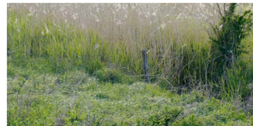
Kun mindre dele af strandengene ved Vestermade afgræsses. Det er vigtigt, at ALLE området strandenge afgræsses. Her yngler bl. a. nogen af de sidste restpopulationer af strandtudse ved Odense Fjord.