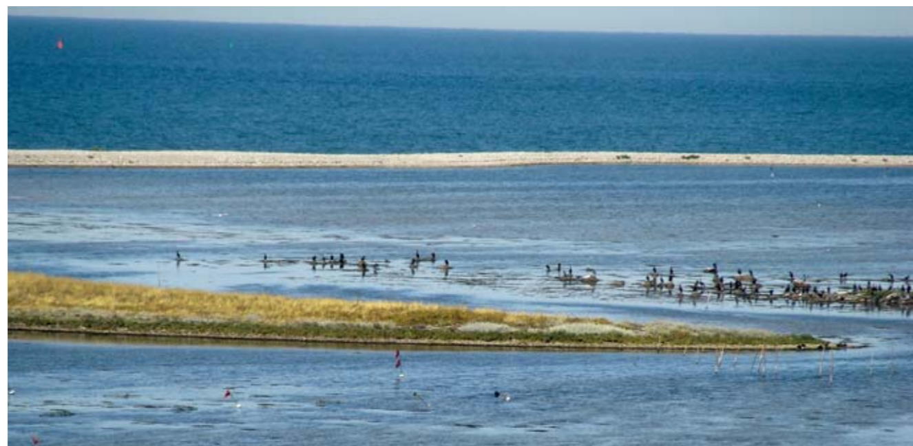
Fællesstrand og Pughavn er meget lavvandet. Derfor raster der tusindvis af vandfugle her, f. eks. store flokke af gennemtrækkende stor regnspove.

Lillestrand er meget lavvandet. Her ligger en del øer, Mejlø, Bogø, Vejlø – nu forbundet til fastlandet ved en lille dæmning og Vejlø Kalv.