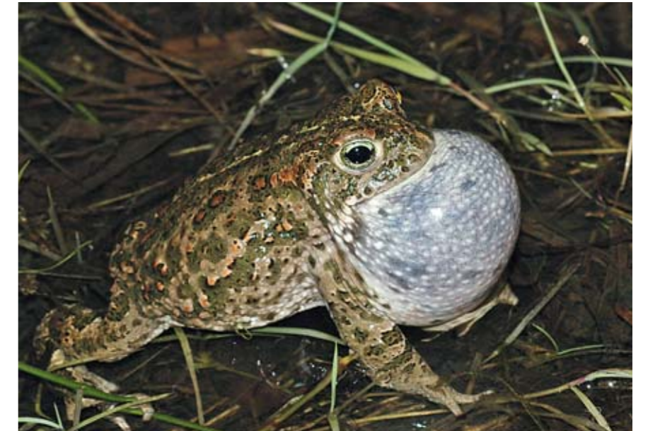
Der skal gøres en stor, målrettet indsats for at bevare strandtudsens i Kerteminde Kommune. Arten er allerede forsvundet fra en hel del lokaliteter i kommunen. Midlet til at nå målet er gravning af vandhuller – med afgræsning omkring hullet samt renovering af eksisterende vandhuller.

Af krybdyr findes hugorm, snog og stålorm. Hugormen findes især på Fyns Hoved. Desuden er der en min-