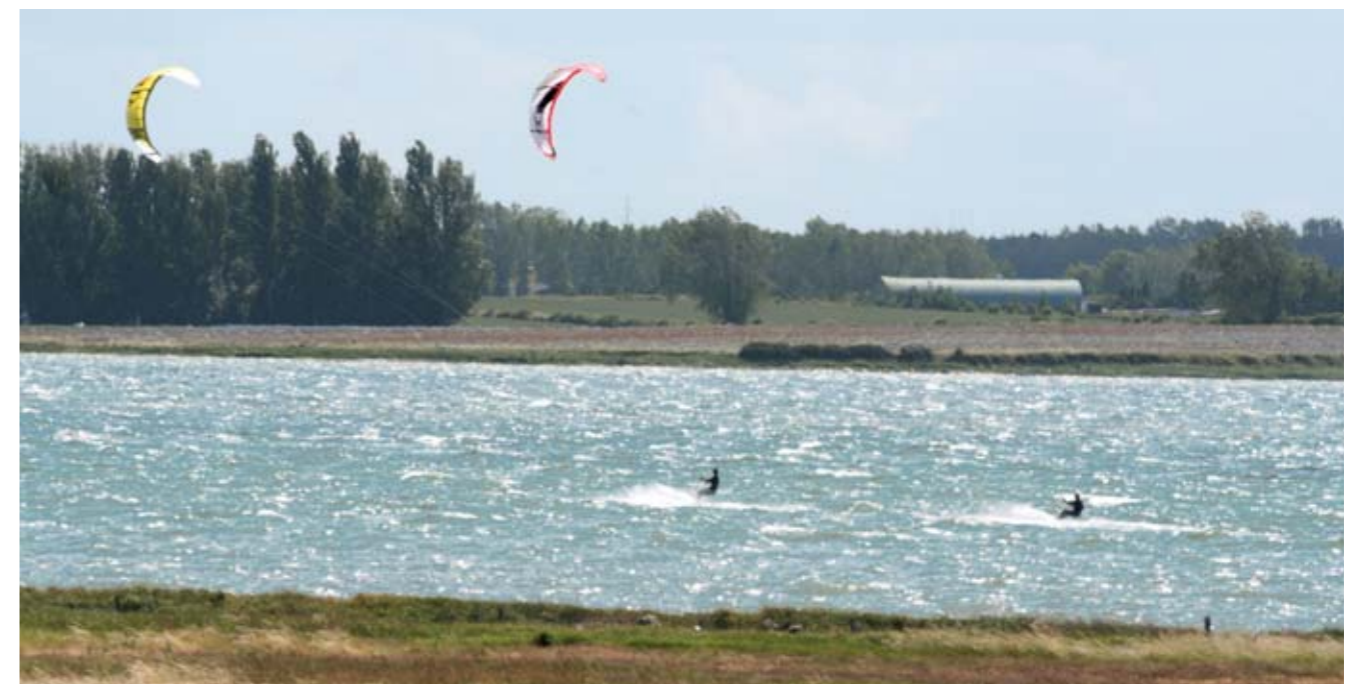
Kite-surfing er en relativ ny aktivitet. Den forstyrrer store fugleflokke der raster i fjordene, f. eks. i Bregør Bugten, samt ynglefuglene, f. eks. på Tornen ved Fyns Hoved. Denne aktivitet skal væk fra de lavvandede farvande og henvises til mere fugletomme lokaliteter.

Vi mener, at denne forstyrrende aktivitet skal væk fra de lavvandede farvande med tusindvis af fugle og henvises til lidt dybere, mere fuglefattige områder.