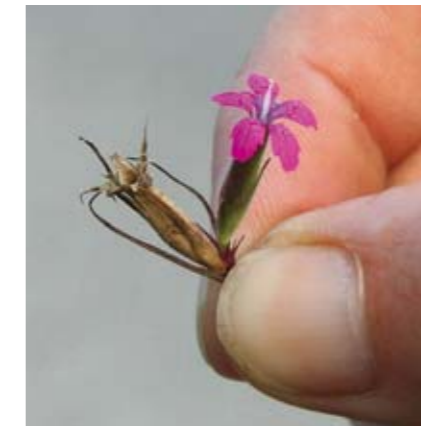
Kost-nelike er "juvelen" i overdrevene ved Bjerget ved Taulund. Området er imidlertid i kraftig tilgroning, bl. a. med træer og buske. Et naturplejeprojekt er stærkt påkrævet.

På Mejlø og Bogø har der et stykke tid været et for lille græsningstryk. Desuden vokser området til med vedplanter. Det ville være en fordel, hvis afgræsningsdyrerne, som i dag er får, blev skiftet ud med kreaturer. På Fyns Hoved bør fårene konverteres til kreaturer.