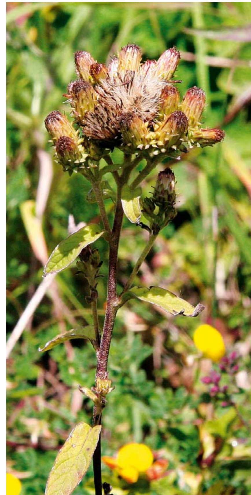
Trekløft-alant er en af de særdeles sjældne planter der vokser på overdrevene i Kerteminde Kommune. Arten vokser bl. a. på Jøvet. Her skal vedplanter udtyndes for at gavne arten.

Hvor meget kontinuerlig drift i form af græsning betyder, er Mejlø og Bogø gode eksempler på. Disse to lokaliteter har været drevet med græsning i århundreder. De har derfor bevaret 4 ud af 5 rødlistearter.