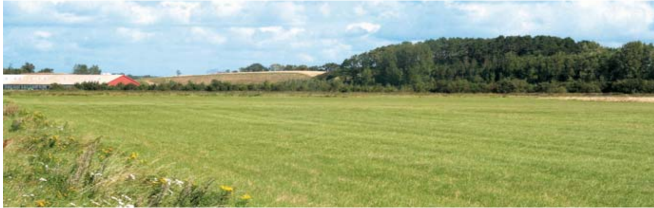
Borret syd for Lillestrand er et af de fine overdrev der i dag er næsten ødelagt ved tilplantning. Borret bør genskabes som et lysåbent overdrev med afgræsning.