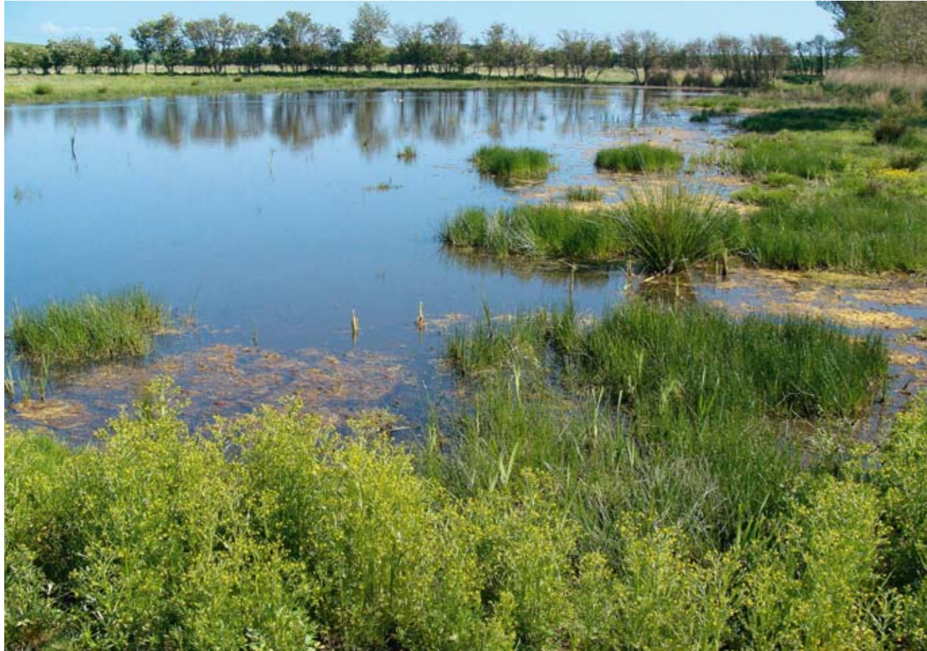
For et par år siden blev der genskabt 25 hektar strandenge i Nordskov Enge. Projektet er meget vellykket. Bl. a. har strandtudsen taget arealet i sin besiddelse.