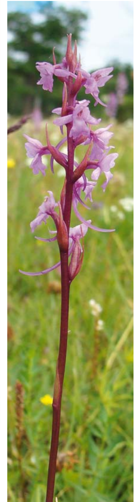
Langakset trådspore er nu også forsvundet fra sit sidste kendte voksested, Urup Dam. Tidligere fandtes den flere steder i kommunen. Arten er helt afhængig af afgræsning og høslæt.