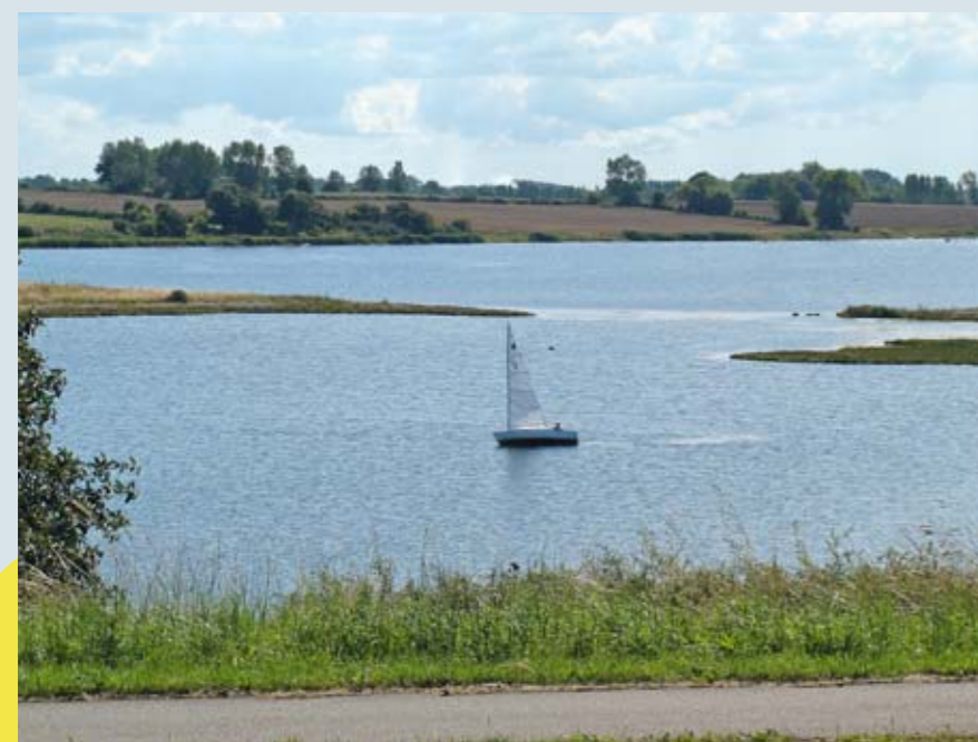
Kertinge Nor er et elsket farvand til småjoller. Her ses en jolle ved Skålholm.

I arbejdet med den danske natur søger Danmarks Naturfredningsforening at sikre, at tabet af den biologiske mangfoldighed standses. Derfor beskæftiger foreningen sig også med land- og skovbrugets produktionsmetoder, der har afgørende indflydelse på naturens vilkår.