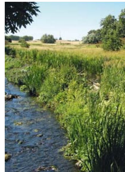
Langs Vindinge Å ligger en række enge, som alle tidligere har været afgræsset. Det er nødvendigt at genoptage afgræsningen for at bibeholde planter og dyr tilknyttet engene. Det vil samtidig holde kæmpe-bjørneklo i skak.

På Fyns Hoved findes der små strandenge langs kysterne.