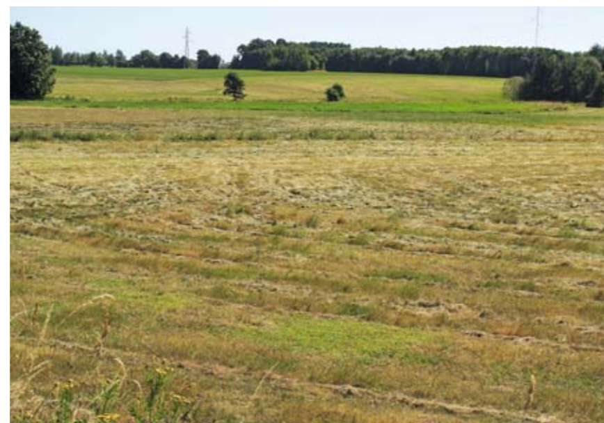
For et par år siden blev der genskabt cirka 13 hektar enge ved Vindinge Å ved Rønninge Søgård. Engene plejes ved slåning. Sådanne vandløbsnære våde enge er fremragende til at uskadeliggøre kvælstof, som er en trussel mod vandmiljøet. Derfor bør flere enge genskabes.