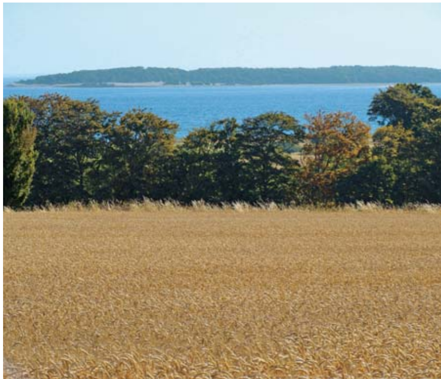
Romsø er perlen blandt kommunens skove. Hvis der blev lavet skovlovsaftaler på andre skove i kommunen - som der er blevet det på Romsø, vil naturindholdet i kommunens skove højnes meget betragteligt.