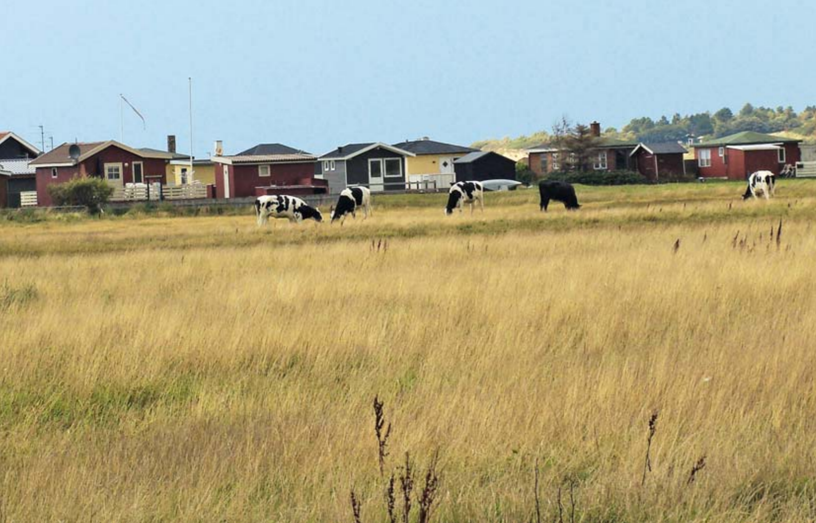
Vore strandenge mister deres værdi for fugle og planter, hvis de ikke afgræsses. Det er derfor væsentligt, at de vigtige strandenge ved sommerhusene ved Dalby Bugten græsses i deres helhed.