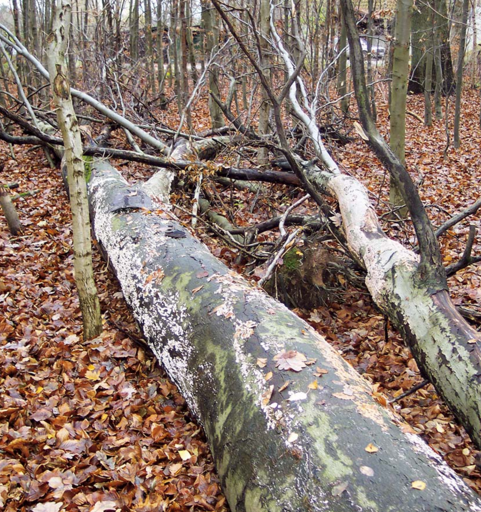
Skove med et større naturindhold er en mangelvare i Kerteminde Kommune. Dødt ved i skovbunden gavner en lang række organismer såsom fugle, insekter, svampe, lav og mosser.