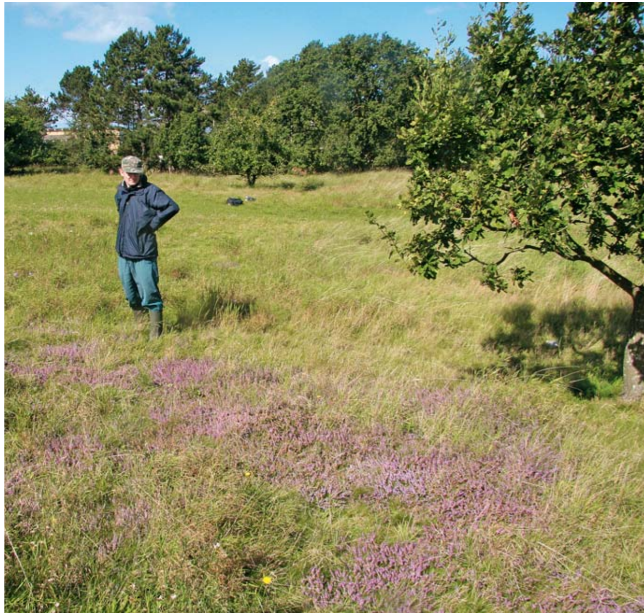
På Langø ligger der ved Højbjerg et meget værdifuldt område bevokset med hedelyng samt andre spændende planter. Området skal friholdes for opvækst af vedplanter.

Sommerhusområderne i kommunen er i høj grad anlagt på tidligere naturområder. Der er stadig rester af natur, som bør bevares i disse sommerhus-områder.