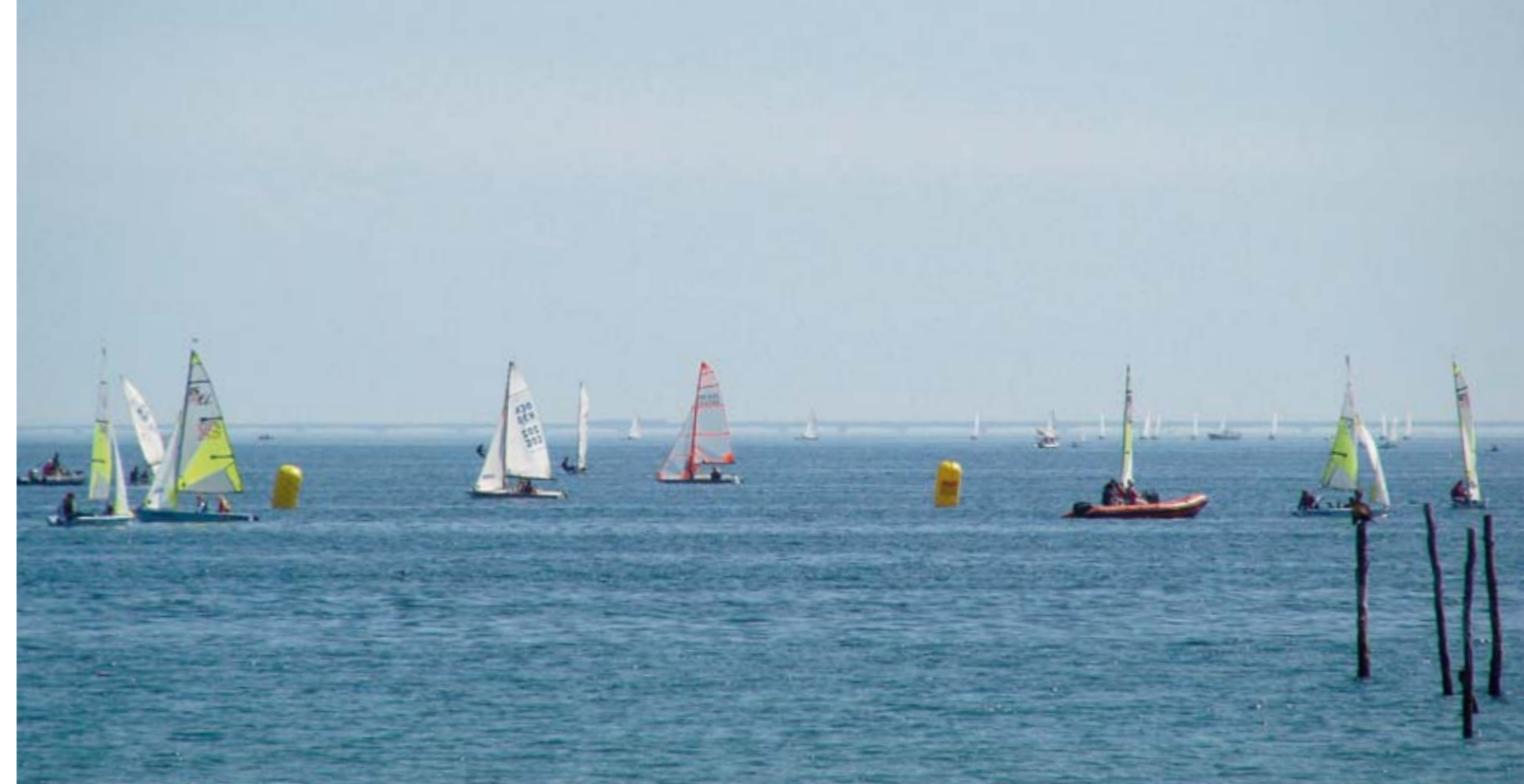
Sejlads med småjoller i Kerteminde Bugt. Bugten er kertemindernes kæreste badestrand og tumleplads for alle mulige fartøjer.

Oppe under Fyns Hoved ligger også flere lavvandede, spændende vandområder.