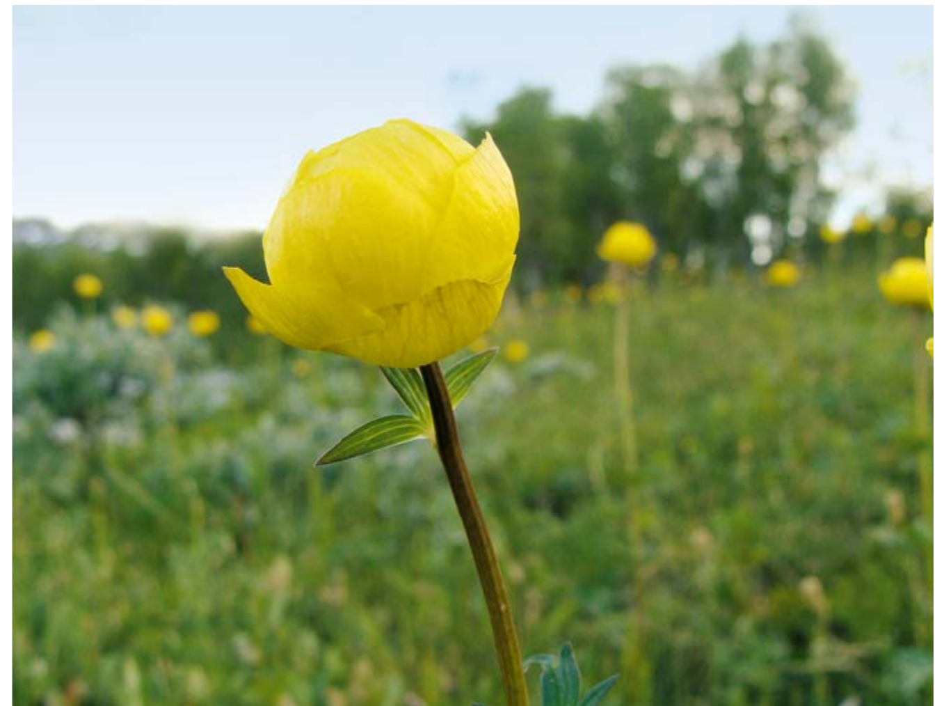
Engblommen var tidligere ret almindelig i Kerteminde Kommune. Arten er i dag forsvundet fra kommunen. "Planen" for Kerteminde Kommune skal sikre, at der ikke mere forsvinder flere plantearter fra kommunen.

vokser stadig mose-pors i Gammel-lung. Fattigkærene er særlig truede, fordi de er kraftigt tilvokset med træer og buske. Desuden trues de af næringsstof-belastning på grund af andeudsætning. Der bør gøres en særlig indsats for denne mosetype.