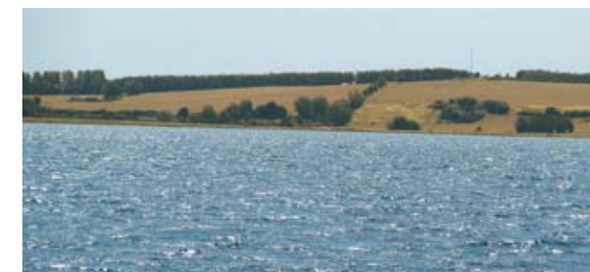
Munkebo Bakkens Odense Fjord-side bør udlægges i græs og afgræsses sammen med overdrevet på Dalby Høj. Der er da store chancer for at sjældne planter fra Dalby Høj vil brede sig ud på bakken.