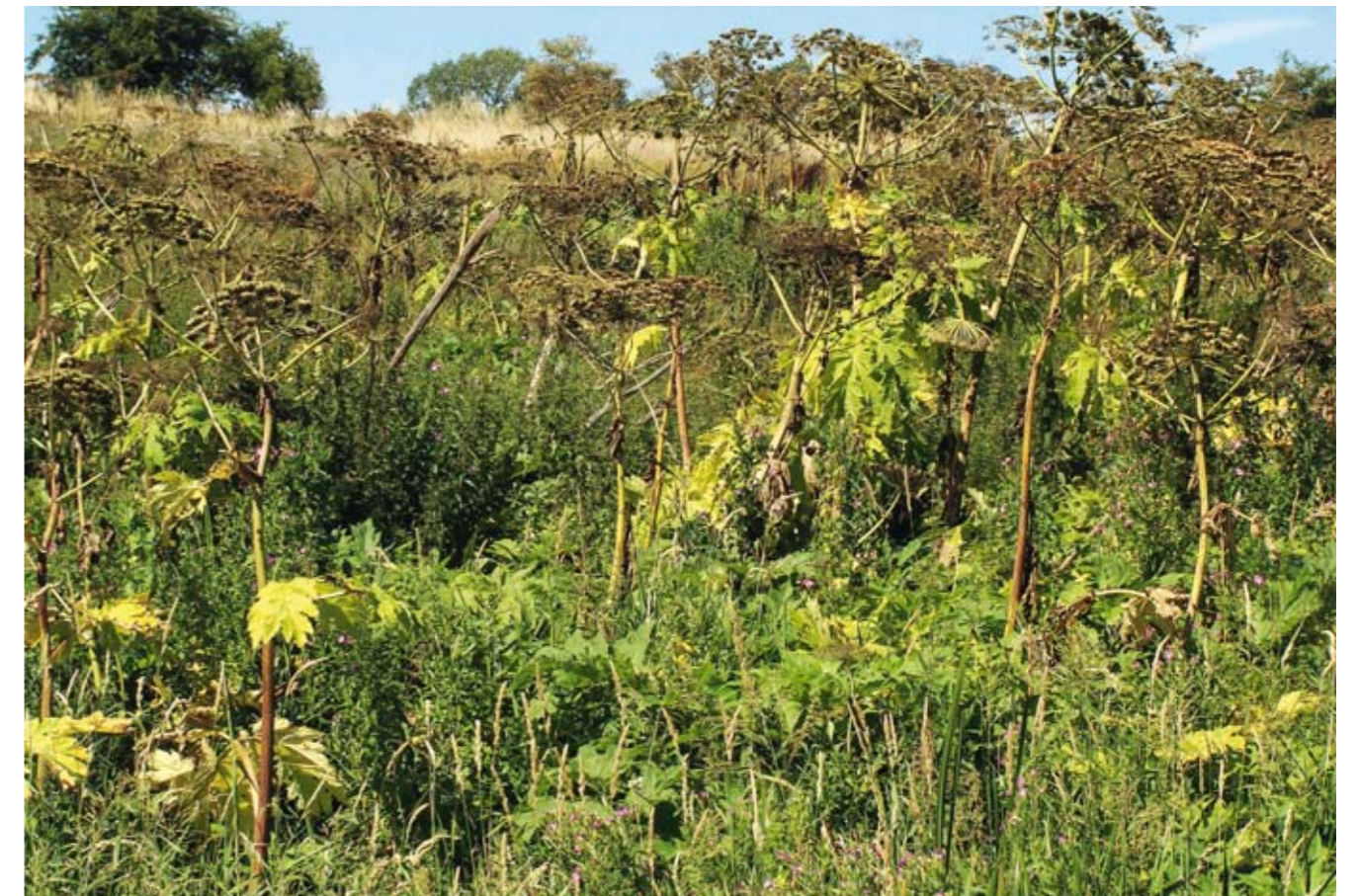
Kæmpe-bjørneklo truer mange plante-samfund, bl. a. rigkærerne ved Bogensø. Der må gøres en betragtelig indsats for at få fjernet arten fra Kerteminde Kommune.

Japansk Pileurt breder sig kraftigt, f. eks. på Kerteminde Sydstrand. Planterne skal fjernes.