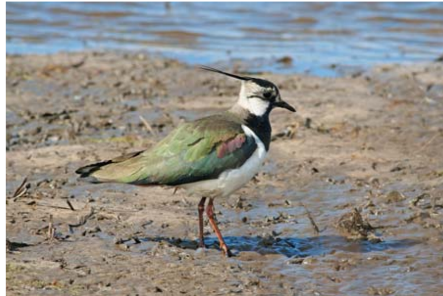
Viben var engang talrig i Kerteminde Kommune. I dag er den helt afhængig af tilskud udefra for at overleve. Skal vi bevare viben i Kerteminde Kommune kræver det mere naturpleje og naturgenopretning. Udlægning af strandenge på Dræby Fed ved Odense Fjord vil gavne arten meget.

Strandengene og engene er især vigtige ynglelokaliteter for vige, rød-ben, strandskade, stor præstekrave og klyde.