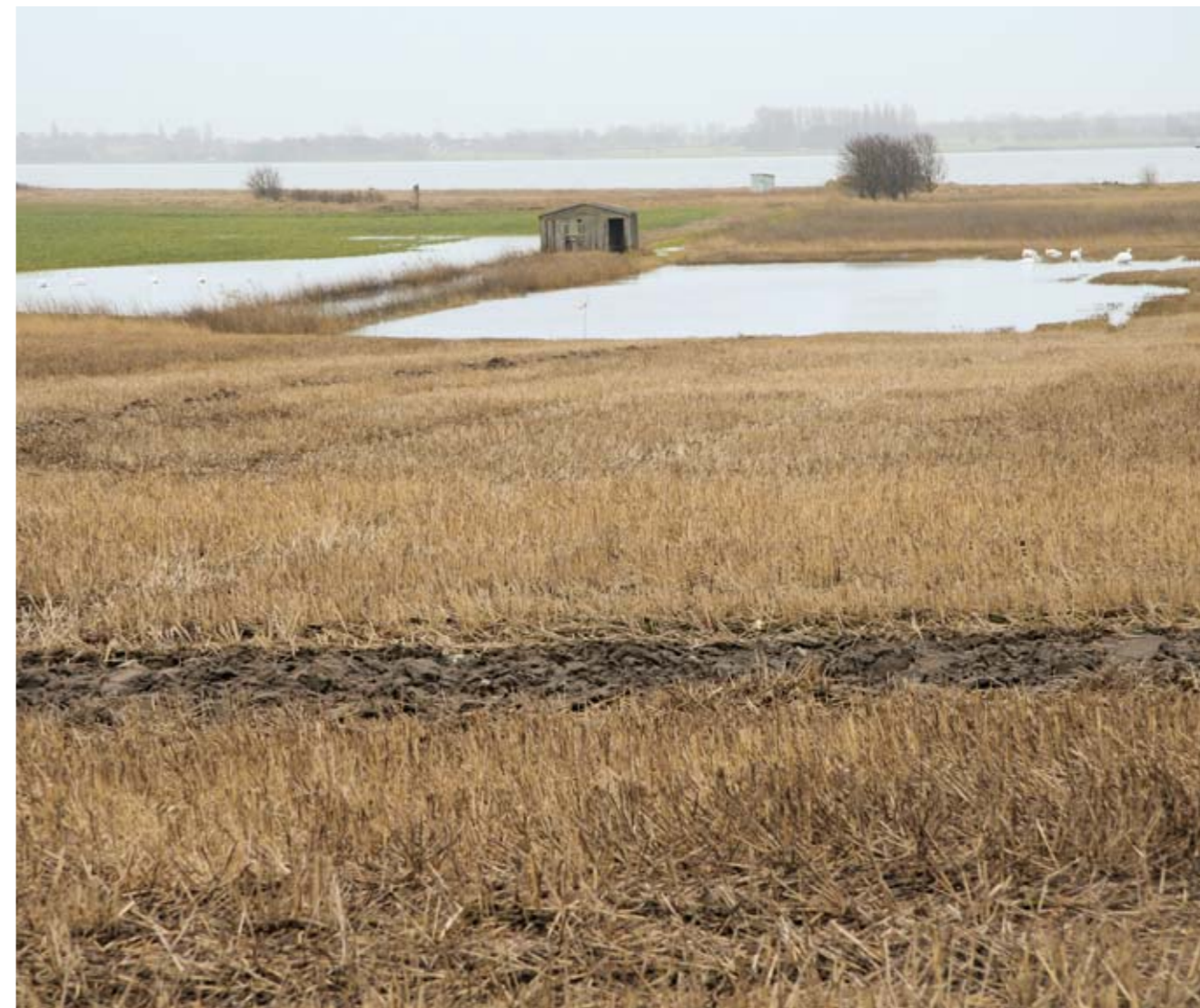
Der er utallige muligheder for at genskabe vådområder i Kerteminde Kommune. Her er det oversvømmelser ved Midskov ved Odense Fjord. Sådanne oversvømmelser pumpes bort.